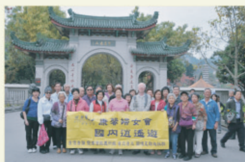
4月6至9日「復活節四天團」，暢遊福建、廈門等名勝