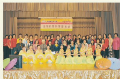
2月26日在鰂魚涌社區會堂舉辦「康馨群聲歌舞慶新春」