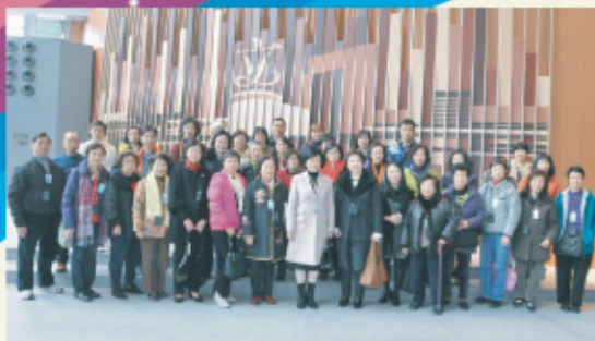
2月9日由立法會議員葉劉淑儀帶領下參觀新立法會綜合大樓