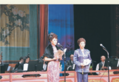
3月10日在西灣河文娛中心舉辦「康馨粵曲會知音」