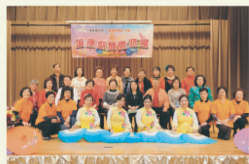
3月24日在鰂魚涌社區會堂舉辦「城康歌舞樂悠揚」