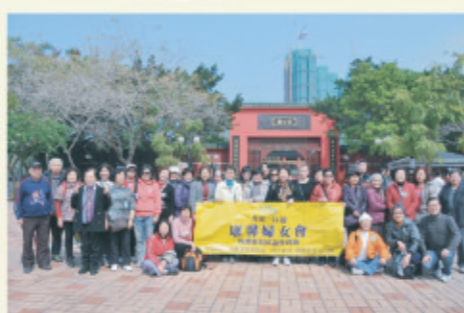
2月19日「龍年新春行大運」