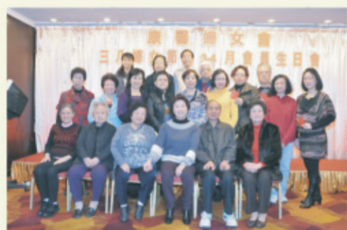
3月3日舉辦「慶祝三八婦女節暨3月4月會員生日會」